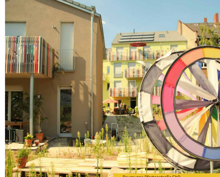
Baugruppe Pfortenstraße GbR