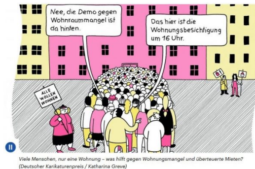
Viele Menschen, nur eine Wohnung - was hilft gegen Wohnungsmangel und übertriebene Mieten?