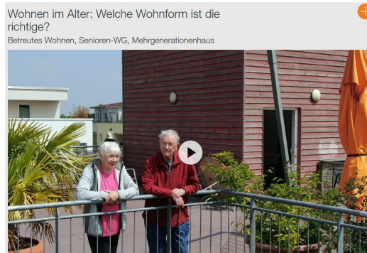
Wohnen im Alter: Welche Wohnform ist die richtige? Betreutes Wohnen, Senioren-WG, Mehrgenerationenhaus

Wie und wo möchte man im Alter leben? Viele Senior*innen lehnen das herkömmliche Pflegeheim ab und möchten möglichst lange selbstbestimmt leben. In diesem kurzen Video werden Vor- und Nachteile von Alternativen vorgestellt.