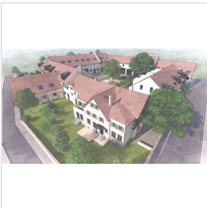
1_20 - Photo

Zimmer: 3,00 Wohnfläche ca.: 103,00 m 2 Kaltmiete: 1.247,00 EUR (zzgl. Nebenkosten) Gesamtmiete: 1.568,00 EUR